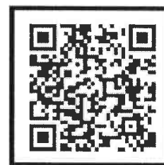
【登録用バーコード】